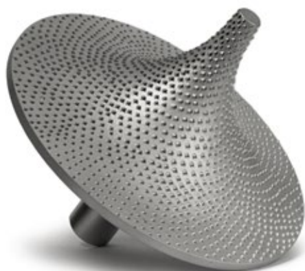
Z75 MILLFOAM Schaft Profilradius Werkzeug in Vielzahnausführung 1/4-Kreis Radius.

Z75 MILLFOAM shank profile radius tool in multi-tooth design 1/4-circle radius.