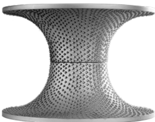
Profilradius in Vielzahnausführung 1/2-Kreis Radius.

MILLFOAM cylinder milling discs in multi-tooth design suitable for 1/4-circle.